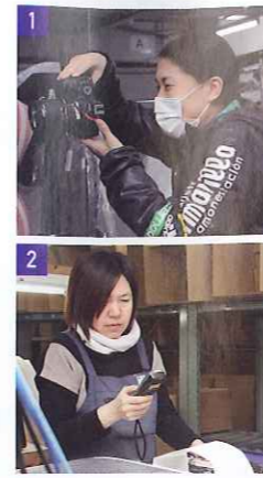
1.撮影風景。本格的な撮影スペースを使いこなし、商品の細かな部分まで確認しながら時間をかけて撮影します 2.出荷状況をチェック。バーゲン期間や土日は特に入念に確認します 3.注意深く商品を検品し、きれいに梱包し直します 4.受注をパソコン入力で管理。その場にいるスタッフとともに多くの荷物を出荷できる状態にしています 5.スローガン。「会社とは家族だと思えます。会社と社員、社員同士が互いを思う愛があれば当社は成長も発展もできない」と会長

揖斐郡大野町に本社を構えるジーエフ株式会社は1990年に設立。現在、国内24、海外に58の拠点をもち、従業員数は5000人以上。本社に併設する本店では地域の女性たちが多く在籍し、正社員、パートを問わず大活躍しています。