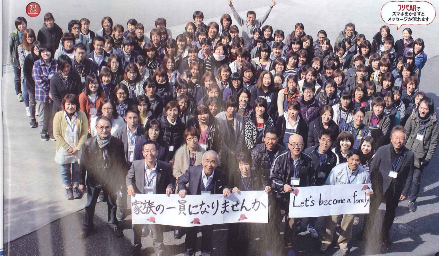
LINEでスマホをかざすとメッセージが流れます